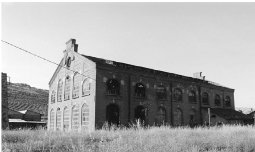
FOTOGRAFÍA 4. Apartadero Calatrava. Central Termoeléctrica (Puertollano).

De forma conjunta hemos identificado un territorio minero correspondiente a lo que los geólogos denominan el Distrito Minero de Valle de Alcudía y el Distrito Minero de Almadén. Un territorio con un largo pasado en la minería y en la industria y un gran potencial territorial para la puesta en valor y correcto aprovechamiento de su legado patrimonial. Como hemos analizado, presenta diversas singularidades ya que «una mina es diferente según el tipo de explotación que se realice, pero también lo es por el ecosistema donde está situada, por la organización social que se implanta en torno a