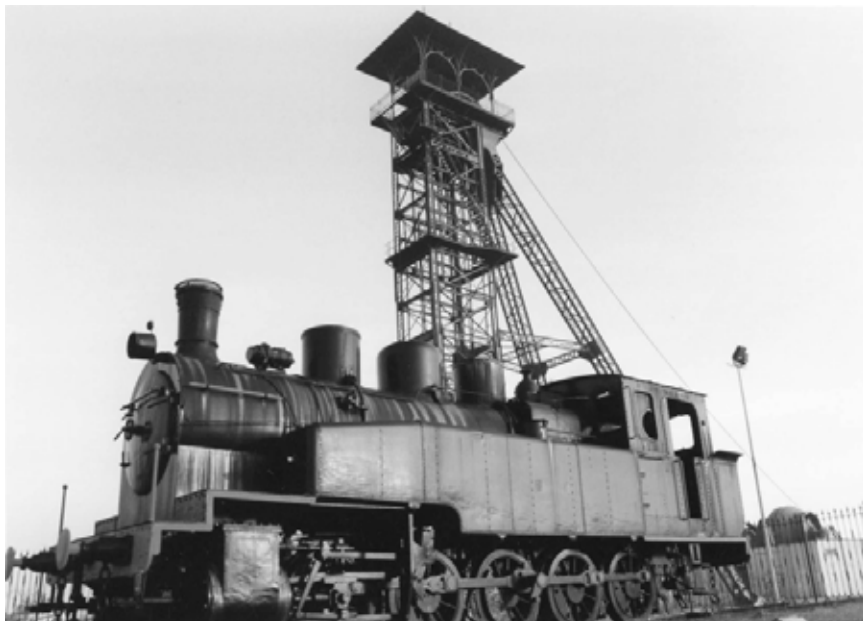
FOTOGRAFÍA 3. Museo de la Minería al Aire Libre. Pozo Norte y «La Gorda» (Puertollano).

año, teniendo en cuenta que «se incrementará considerablemente (...) al contar con una población de más de cien mil habitantes comarcales, doscientos cincuenta mil provinciales y con un potencial de turismo nacional de gran magnitud al encontrarse la localidad unida por AVE con Madrid, Ciudad Real, Córdoba y Sevilla» (A.P., 2000). Aspectos ya analizados (Cañizares, 2001a).