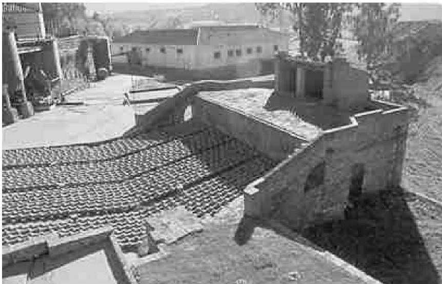
FOTOGRAFÍA 1. Hornos Bustamante (S. XVII). Explotaciones de cinabrio (Almadén).

do, su antiguo poblado minero ha desaparecido y tan sólo se adivinan algunas edificaciones dedicadas a la extracción de plata, entre las que se encuentra un lavadero . Su elemento más representativo es un castillete , construido en obra de fábrica, a base de mampostería y ladrillo visto, que funcionó con poleas en su parte superior y una sala de máquinas de grandes dimensiones que corresponde al período de mayor auge (1887-1934) bajo el dominio de la Sociedad Minero-Metalúrgica de Peñarroya (S.M.M.P).