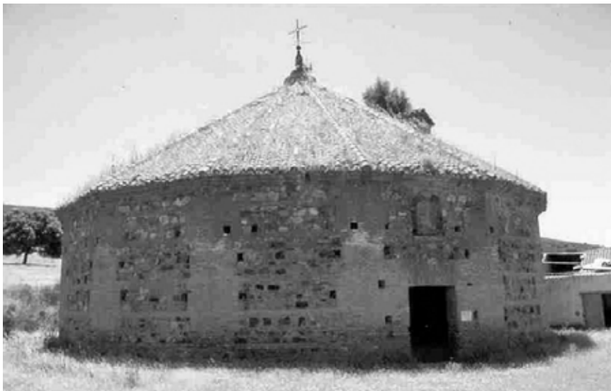
FOTOGRAFÍA 2. Baritel de San Andrés (S. XVIII). Mina Nueva Concepción (Amadenejos).

En el caso de la Mina Diógenes , muy relevante durante la romanización pues perteneció al distrito minero de Cástulo (Linares), se conserva, de época contemporánea, el castillete que daba acceso al pozo n. 5, aunque no in situ sino instalado en el patio de la Escuela Politécnica de Almadén. Su torre está compuesta por cuatro planos de perfiles roblonados que soportan un quinto plano sobre el que se apoya la plataforma en la que se ubican las poleas de los cables de extracción (Peris, 1995: 115). Del resto de edificaciones que conforma-